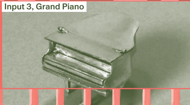
Input 3, Grand Piano